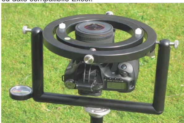
Cameră digitală SLR cu dispozitiv montare SLM8