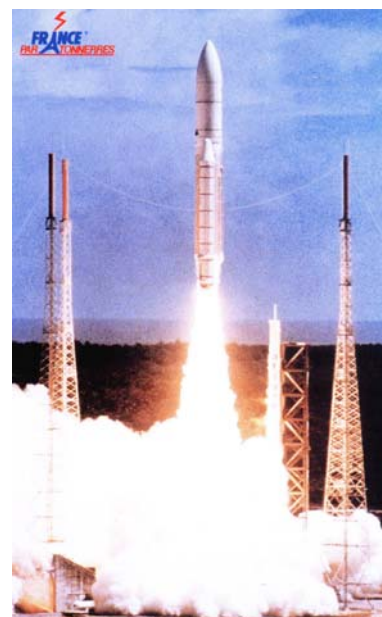
Rampa de lansare pentru Ariane 5

Aceste cercetări au permis să se constate că în stadiul actual al cunoștințelor, numai sistemul de tip IONIFLASH poate ameliora în mod semnificativ performanțele paratrăsnetului tijă simplă, la toate condițiile de test.