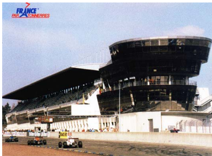
Circuitul de 24 de ore de la Le Mans

Paratrăsnetul are funcția de a emite o descărcare electrică ascendentă pentru a devia efectul liderului descendent. Propagându-se spre nor, această descărcare ascendentă crează un câmp suficient pentru a modifica traiectoria liderului descendent : lovitură de trăsnet fiind condusă astfel în sol. Acest proces poate să se efectueze în mod natural, dar acțiunea paratrăsnetului IONIFLASH permite o declanșare mai rapidă și oferă deci o protecție mai eficace. Acesta este conceptul avansului de amorsare.