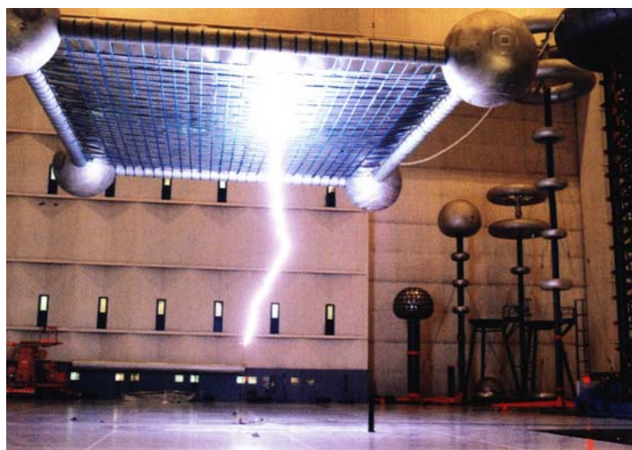
Exemplu de șoc realizat în laboratorul EDF des Renardieres

Evaluarea valorii medii a lui dT trebuie să fie efectuată asupra unei serii de 100 de șocuri, respectiv asupra două configurații corespunzătoare paratrăsnetului cu dispozitiv de amorsare (PDA) și paratrăsnetului tijă simplă (PTS). Condițiile naturale de câmp sunt simulate în laborator prin suprapunerea unui câmp electric permanent și al unui câmp de impuls asociat unui electrod cu formă de platou situat la o înălțime H de la sol.